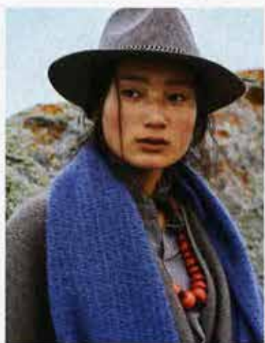
Echarpe en laine de yak de l'atelier Noriha.