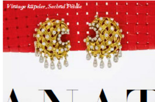
Vintage küpeler, Sebnül Yıldı