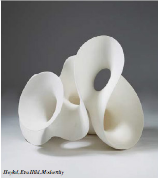
Heykel, Eva Hild, Modernity