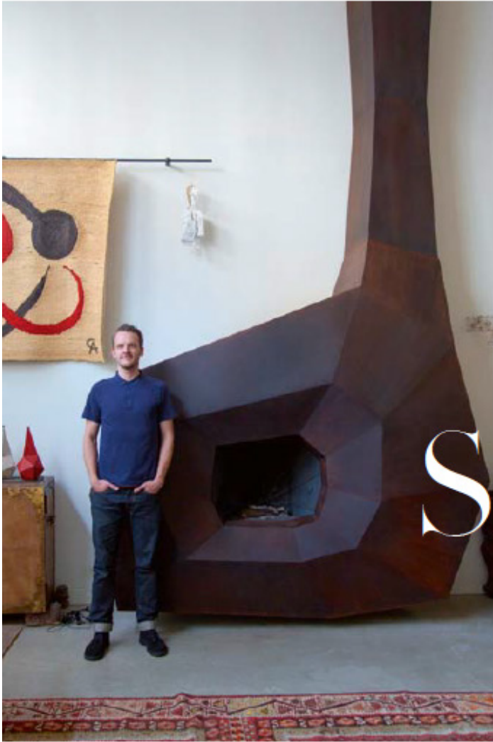
XI. Baca, 2019, Fabion von Spruckelsen, Spazio Nobile