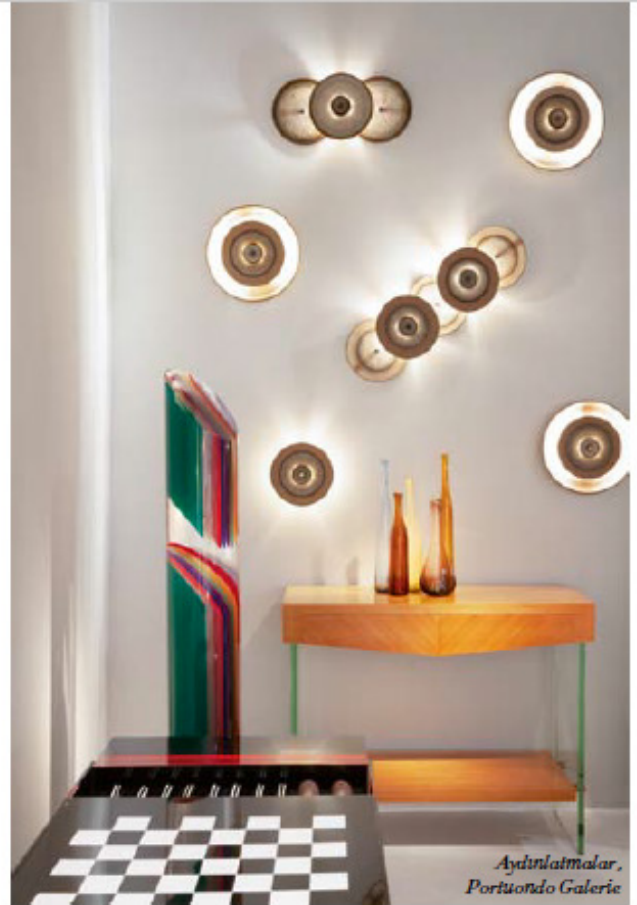
Aydınlamalar, Portuondo Galerie