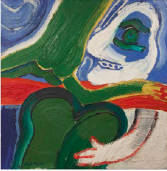
L'amour en Laptonie II, Yağlıboya, 1968, 120x120, Lindstorm, Galerie Protée