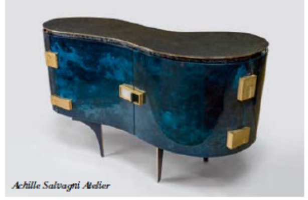
Achille Salvagni Atelier