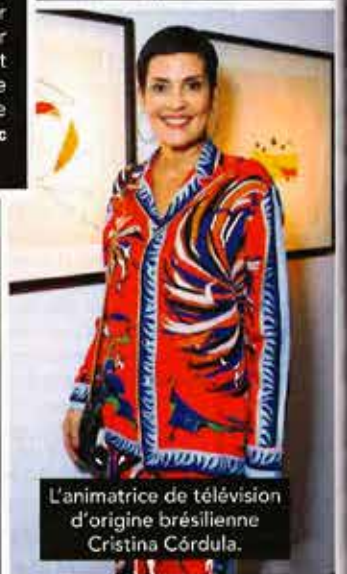
L'animatrice de télévision d'origine brésilienne Cristina Córdula.