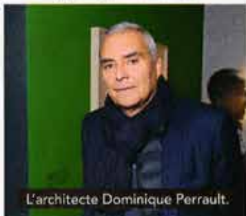
L'architecte Dominique Perrault.